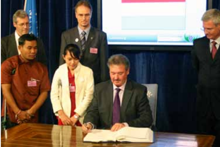
2008年12月3日，奥斯陆（挪威） 卢森堡副首相兼外交和移民大臣让·阿瑟伯恩（Jean Asselborn）签署禁止使用、制造、转移和贮存集束弹药的国际《集束弹药公约》。卢森堡于2009年7月17日批准公约，是首批通过该公约的国家之一。

卢森堡致力于完善多边体系，特别是通过联合国改革，包括旨在变得更具代表性、更透明和更开放的安理会改革。