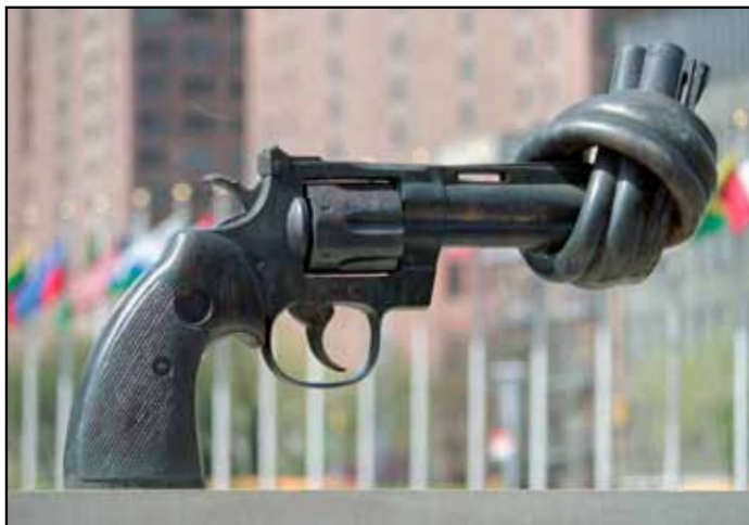
المسدس المعقود، هدية لوكسمبورغ للأمم المتحدة، 1988